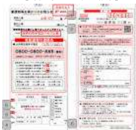
【郵便局のご不在連絡票】